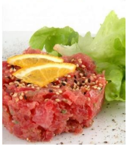
Tartare de thon au citron